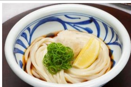
つるさく [讃岐うどん]

[写真]ダブルカルビ石焼井セット(スペシャルプライス)：1,038円(税込) (セノバ限定) 販売期間：6/24(木)～30(水)