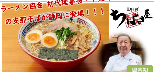
支那そば ちばき屋 [ラーメン]

東京葛西で1992年創業の老舗。和食歴20年の技で作る一杯、繊細ながらもどこか懐かしい味わい。今では定番の半熟煮玉子もはじまりは「ちばき屋」店主・千葉 憲二創案によるもの。