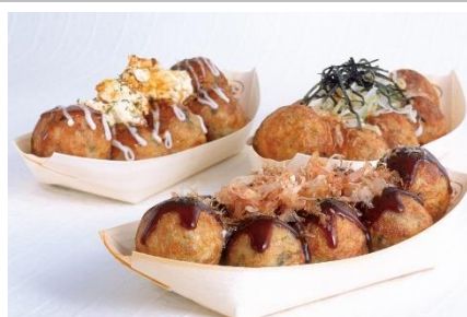
築地 銀だこ GINDACO

コシの強い茹でたての麺と秘伝の出汁を本場讃岐のセルフ方式でご提供。お好みの具材やサイドメニューを選んで自分流のうどんが楽しめます。