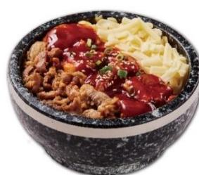
韓美膳 ハンビジェ